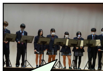
音楽の授業で練習したトーンチャイムの演奏。緊張しましたが、息を合わせて素晴らしいメロディーを奏することができました。