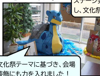
文化祭テーマに基づき、会場装飾にも力を入れました！